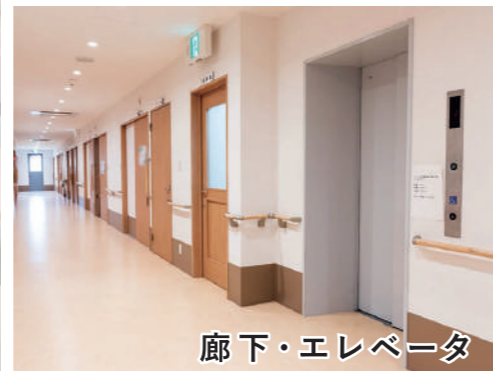
廊下・エレベータ