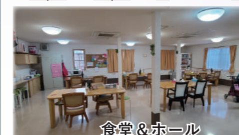
食堂 & ホール

玄関を入ると受付、食堂ホールがございます。建物全体の間口は狭く見えますが、奥行きがあるので、ゆったりとしたスペースを確保しております。全室収納付き室内トイレ付きで、プライバシーに配慮した個室となっております。室内廊下やエレベーター周辺にも十分な広さを確保しており、入居者様の安全を最大限に考慮した設計を心がけております。