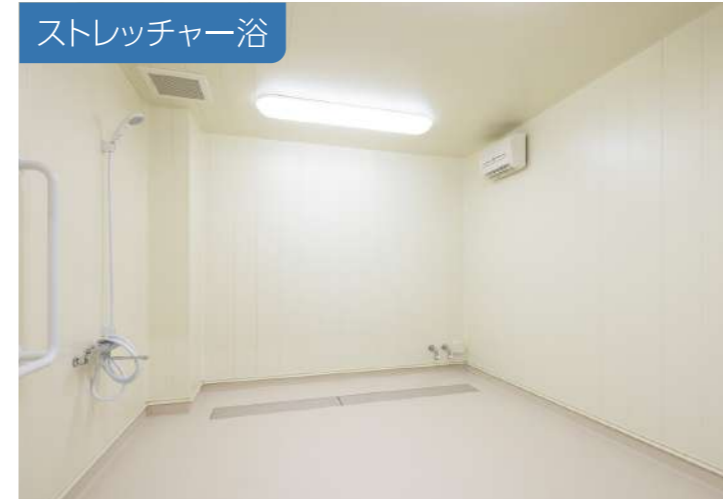
ストレッチャー浴