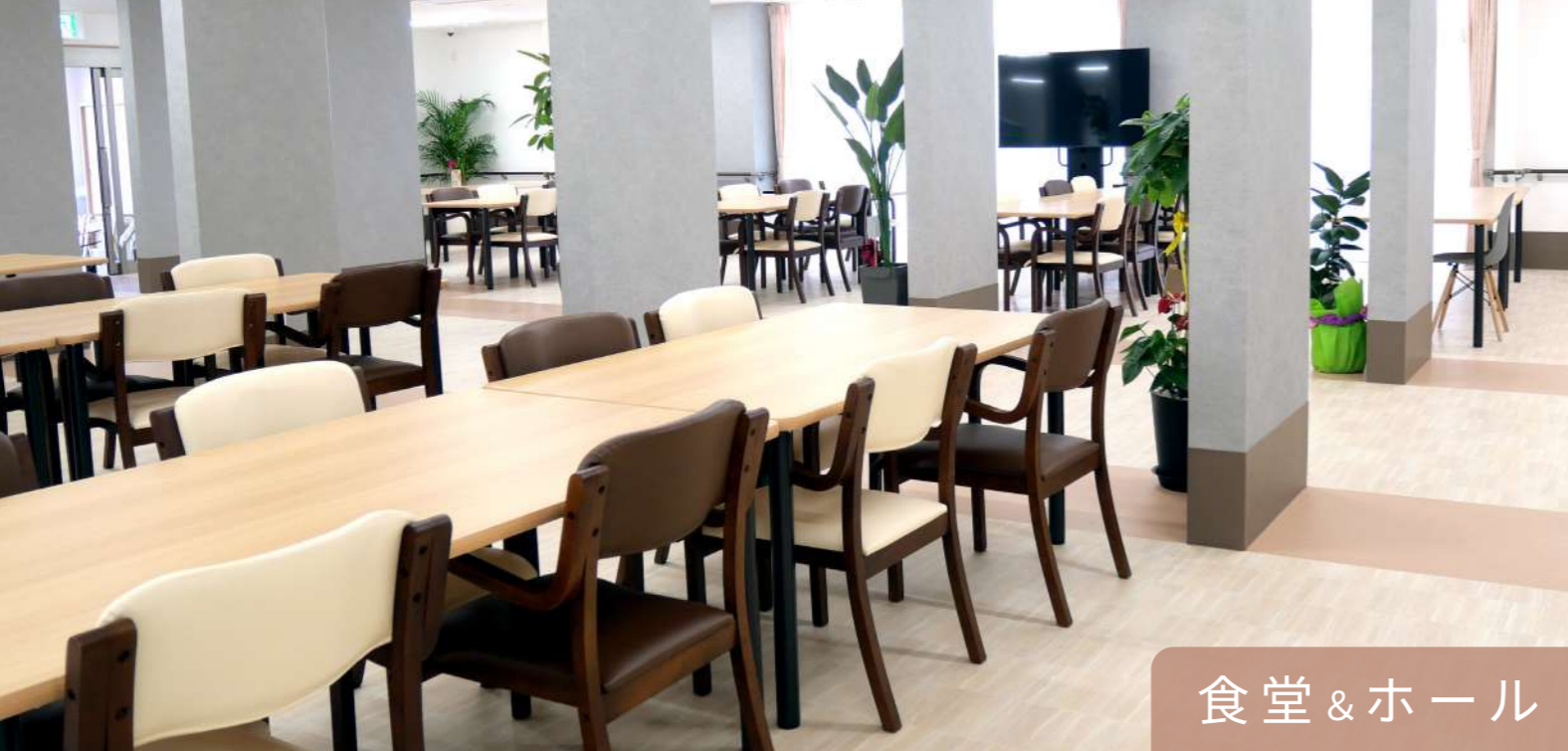
食堂 & ホール

医療体制も充実しておりますので安心して暮らしていただけます。 リーズナブルな料金で、心温まるワンランク上のサービスを目指しています。